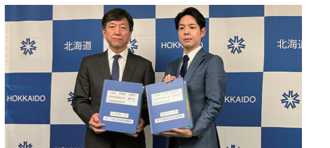
2町村の報告書を手にする鈴木知事と山口理事長(左)(北海道庁にて)

いる」、神恵内村の高橋昌幸村長からは「丁寧で分かりやすい説明と情報提供に努めてほしい」などのコメントをいただきました。鈴木直道知事からは、概要調査に移行する場合は道の条例を踏まえ現時点では反対するとのお考えとともに、「国民的な議論が必要。全国、特に若い世代にも最終処分事業の理解が促進されるよう取り組みを進めてほしい」とのご要望をいただきました。これに対しNUMO理事長の山口は、「地域の皆さまに調査で分かったことを丁寧にお伝えするとともに、全国的に最終処分事業への理解が深まるよう全力を尽くす」と決意を示しました。