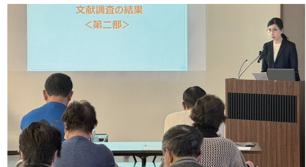
説明会の様子(神恵内村)