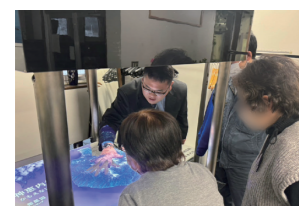
神恵内村の立体模型に調査結果をわかりやすく投影したものをを用いて説明