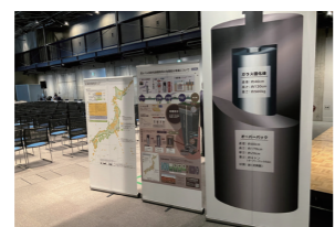
会場内の展示物(札幌市)

もっと詳しく! 報告書一式や各説明会の詳細などについては、こちらからご覧ください。