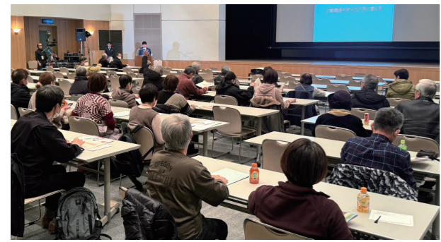
説明会の様子(寿都町)

今後も、地域の皆さまに最終処分事業のことや、寿都町および神恵内村の文献調査で分かったことについて、丁寧にお伝えしていきます。