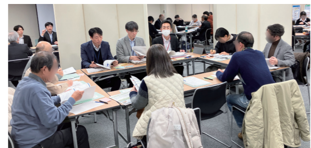
大阪会場の様子(12月19日)

また、今年2月には東京で「あなたと一緒に地層処分を考えるシンポジウム2025」を開催予定です。ぜひご参加ください。