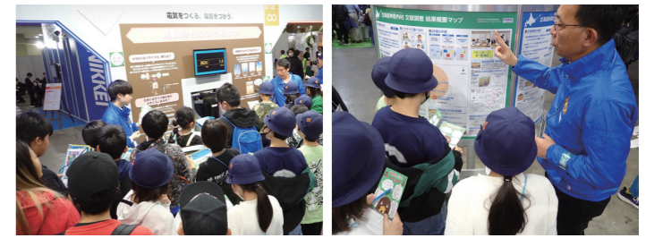
左上:多くの方にご来場いただきました 右上:文献調査の結果概要についてもご説明させていただきました 左:「グーモ」今年も登場!

また、北海道寿都町と神恵内村の文献調査報告書が縦覧中であることを踏まえ、文献調査報告書の概要や北海道の状況についてご覧いただけるコーナーも設置しました。来場者からは、「北海道だけの問題ではなく全員で考えるべき問題だと思った」や「大都市の人たちが地域のことをもっと知ることが大切だと思った」などのご感想をいただきました。